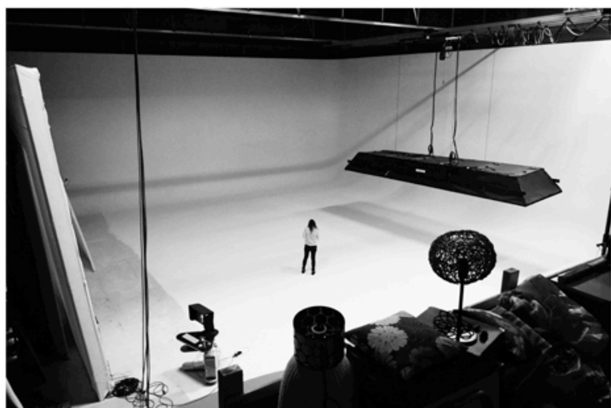
GRAND PLATEAU VUE BOITE LUMIERE HENZEL

hauteur sous structures: 8m hauteur sous plafond: 11m passerelle à 9 m de haut